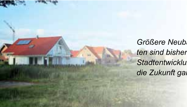
Größere Neubaugebiete wie hier in Ahlten sind bisher wichtiger Bestandteil der Stadtentwicklung gewesen. Müssen wir für die Zukunft ganz neue Ideen entwickeln?